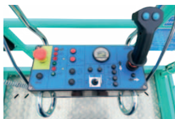
Quadro di comando semplice e intuitivo asportabile dalla navicella per carico/scarico della macchina