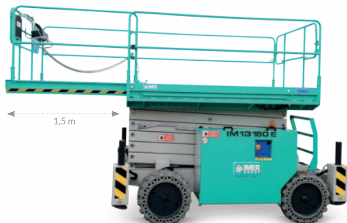
Estensione manuale della piattaforma di 1,5 m per una lunghezza complessiva di 4,2 m