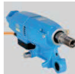
Particolarmente compatto e leggero