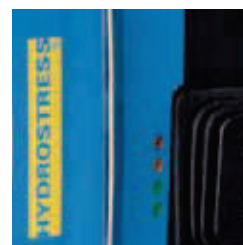
Indicatore di potenza emanazione e guida di livellamento